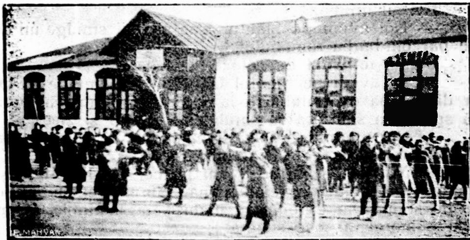
Exerciții de gimnastică cu elevii de la Dorobanțul-Tulcea