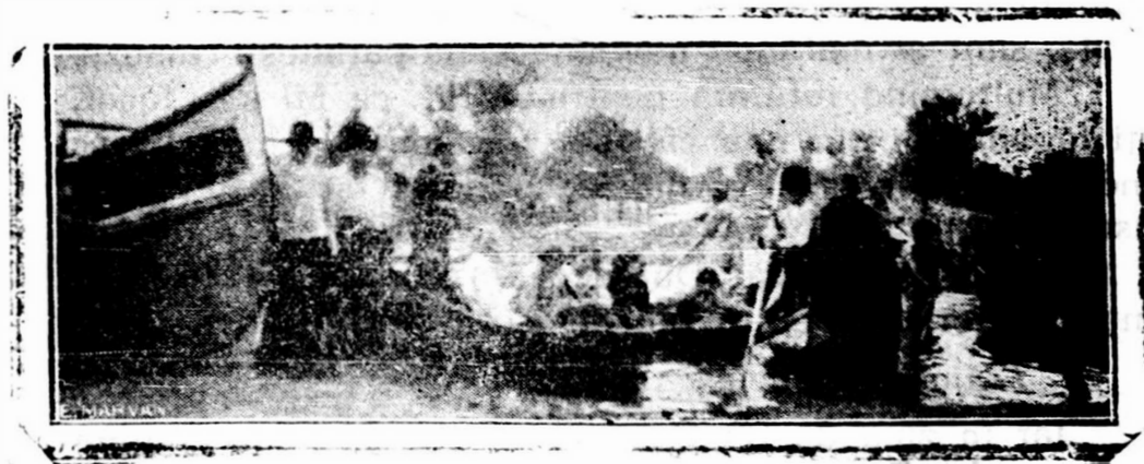
Elevii dela școala din Pisica—Tulcea, pleacă dela școală cu bărcile, satul fiind complet inundat.