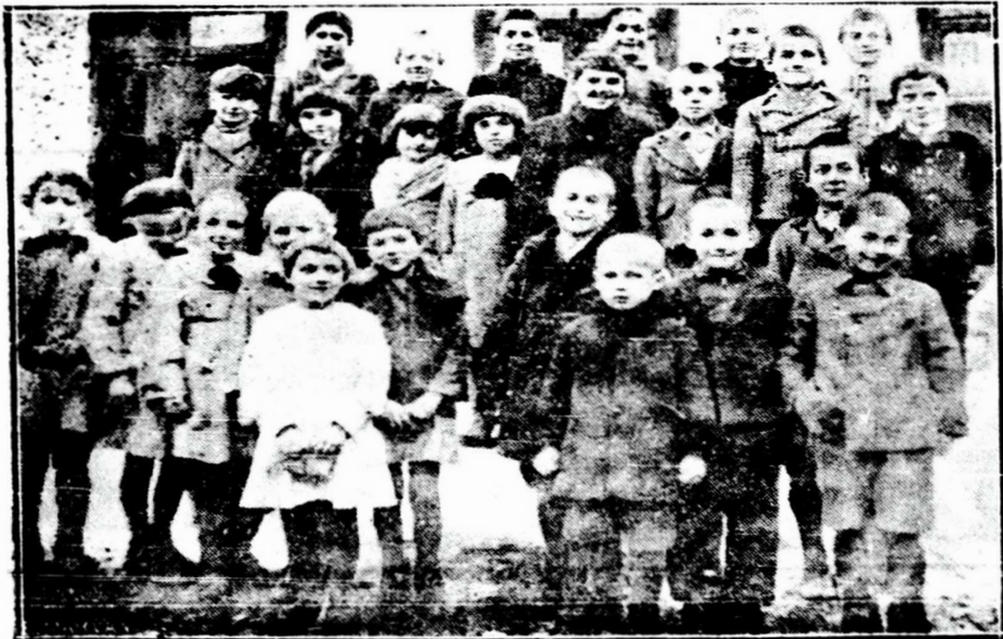
Un grup de cititori de-ai revistei dela școala din Isaccea